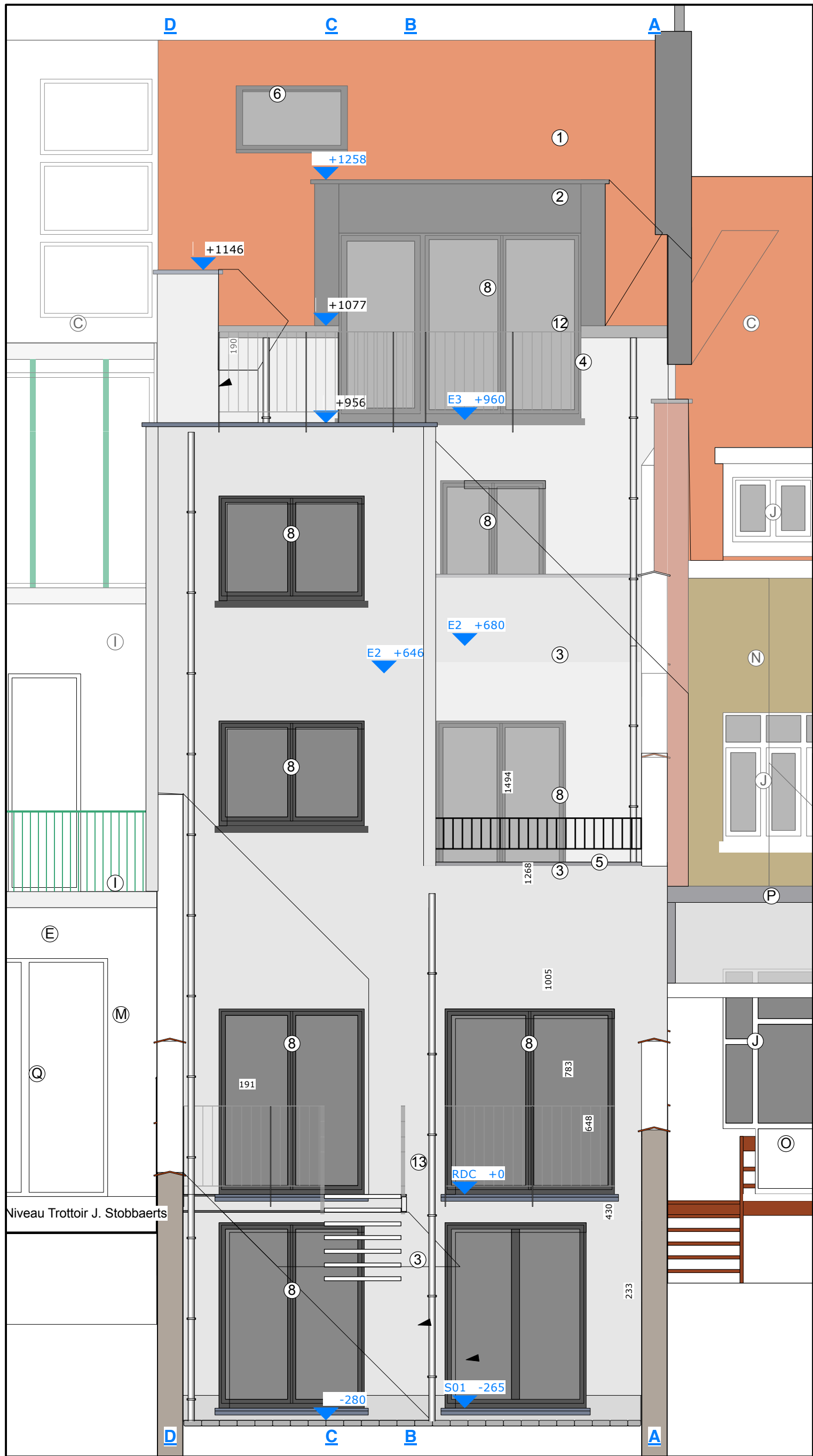
Façade arrière | Achtergevel 1:50

Garde-corp terrasse aligné au conduit technique. Terrasse aligné à la trémie technique. Droit de vue respecté Garde-corp terrasse aligné au conduit technique. Toiture végétal extensive.